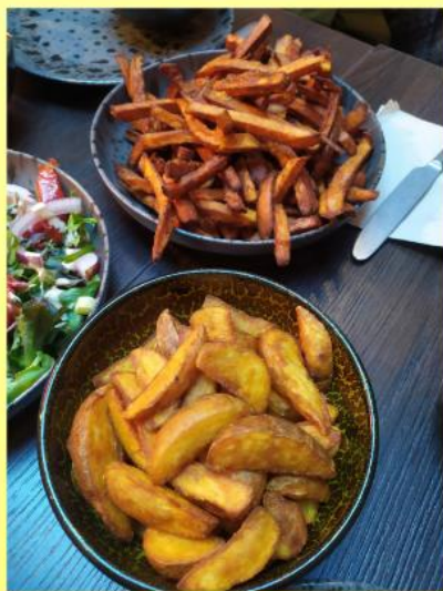
Boven: Sweet potato fries Onder: spicy potato wedges